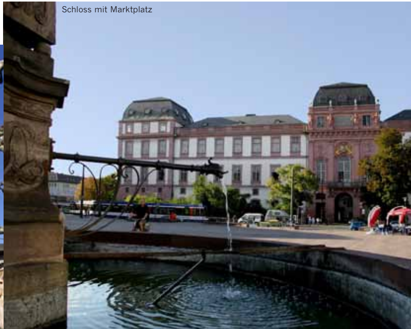
Schloss mit Marktplatz