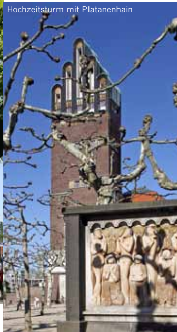
Hochzeitsturm mit Platanenhain